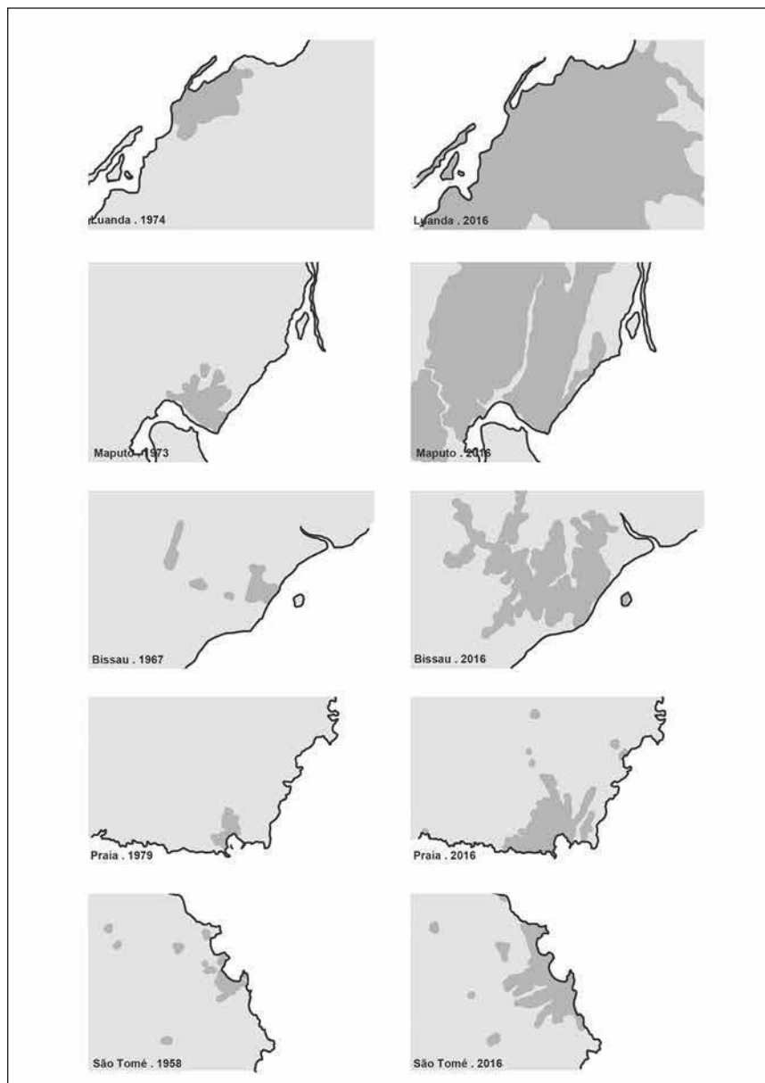
Figura 3: Diagramas, à mesma escala, do crescimento das áreas urbanas, mostrando: Luanda em 1974 e 2013 (com base em Castro & Neto, 2014), Maputo em 1973 e 2008 (com base em Henriques, 2008), Bissau em 1967 e 2009 (com base em Silva, 2010), Praia em 1979 e 2010 (com base em Lima, 2015) e São Tomé em 1958 e 2010 (com base em Fernandes, 2016)

têm-se apresentado como forma de obtenção de um lugar e meio de satisfação das necessidades das famílias de menores rendimentos (Figura 3).