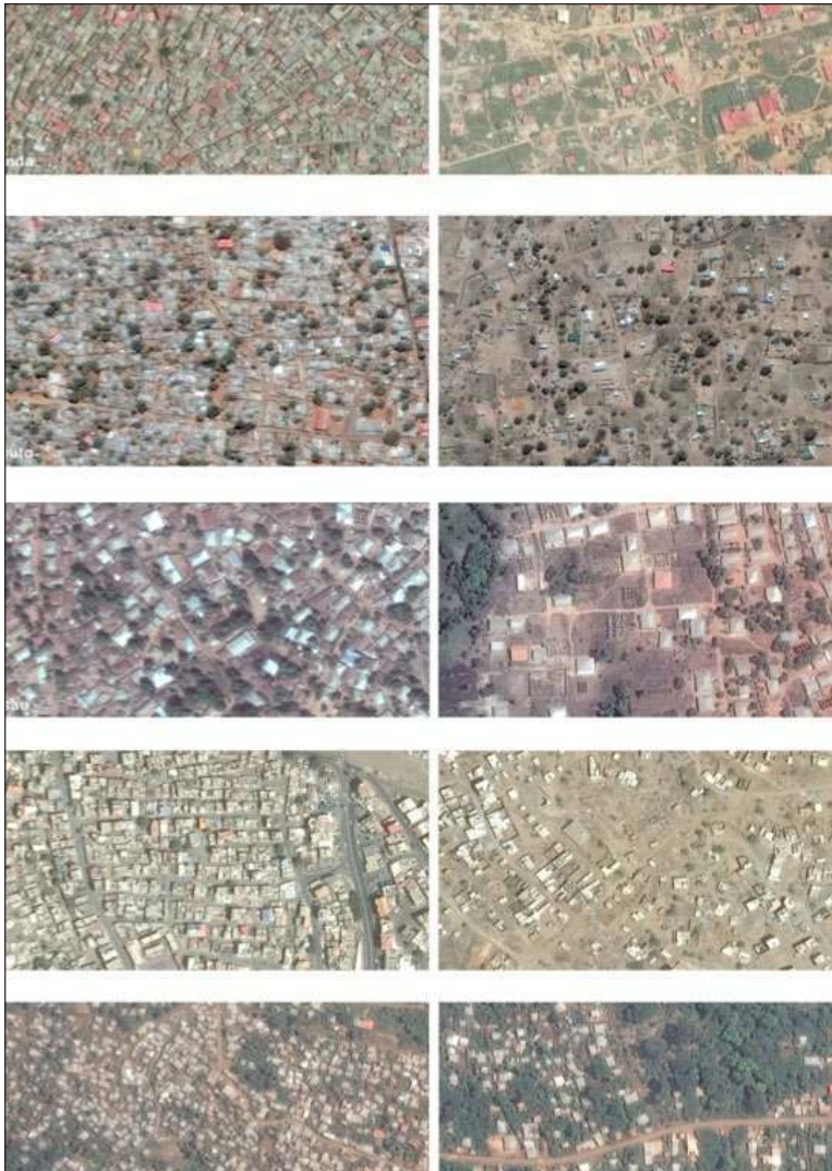
Figura 4: Amostras, à mesma escala, de tecido urbano com prevalência de habitação auto-produzida, em zonas centrais e limítrofes das áreas urbanas de, respectivamente: Luanda, Maputo, Bissau, Praia e São Tomé (GoogleEarth, 2015)

Conquanto tal posição possa afigurar-se extremada, de alguma forma ilustra a necessidade de questionar as abordagens e os impactos, assim como os actores envolvidos nas políticas urbanas que têm a missão de contribuir para um “direito à cidade”.