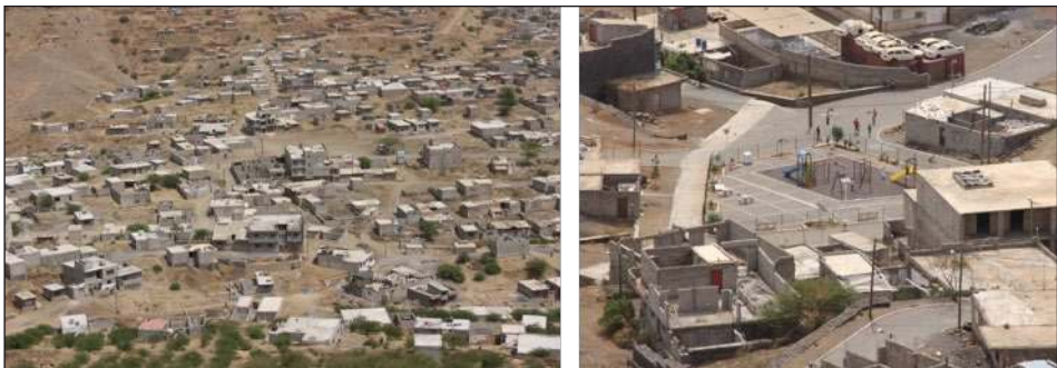
Figura 5: Expansão da Cidade da Praia e exemplo de requalificação do espaço público (A. S. Fernandes)

Desta forma, mais do que contrapor as diferentes estratégias de intervenção – provisão habitacional versus requalificação do existente –, urge antes avaliar e discutir a sua extensão, o seu efectivo impacto na melhoria das condições de vida e, acima de tudo, analisar o perfil dos beneficiários abrangidos, para que as situações mais críticas e de maior privação constituam, de facto, a prioridade de intervenção das políticas urbanas, objectivo que recorrentemente acaba por ser secundarizado face a outros objectivos. Nesse enquadramento, um dos maiores desafios da actualidade para a equidade será debater e reequacionar o papel da governação local, assim como a responsabilidade (política) dos técnicos incumbidos da análise e gestão do ambiente construído.